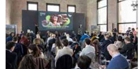
La presentazione al pubblico del masterplan, firmato dallo studio di progettazione MCA - Mario Cucinella Architects, di Milano Santa Giulia.